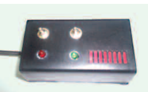
Fraude eléctrico: curioso aparato para robar energía. Pág. 8