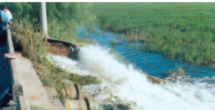
Las bombas de desagote trabajaron a pleno para despejar los caminos anegados por el agua.

Durante doce horas, el pesado equipamiento tuvo que superar rutas cortadas y transitar por caminos alternativos también afectados por el agua. El aporte de los lugareños fue fundamental: ellos fueron los encargados de guiar a la caravana y buscar las huellas para ponerla a salvo de descarrilamientos y empantanadas. El espíritu solidario fue una constante durante las diez jornadas que duró el operativo, realizado en el marco del convenio de colaboración firmado el año pasado entre EPEC y la Empresa Provincial de Energía de Santa Fe (EPE).