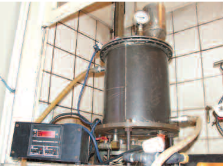
Reactor experimental de PCB, en pleno funcionamiento, en el laboratorio de Gestión Ambiental, ubicado en el predio de la Central Deán Funes.

El siguiente paso fue llevar este desarrollo a nivel industrial. De este modo, durante el año pasado, se construyó un segundo reactor para el tratamiento del PCB, pero a escala real y con capacidad para tratar 1500 litros de aceite. Este