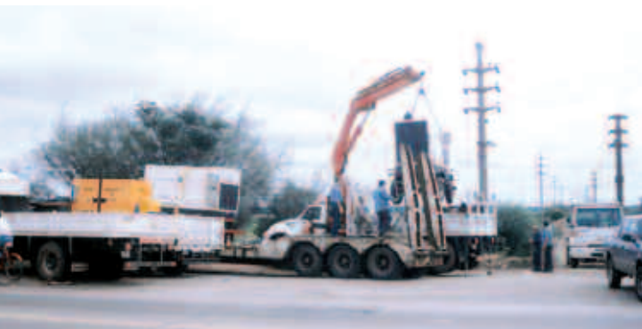
En los semirremolques se transportaron los grupos generadores y las bombas de desagote.