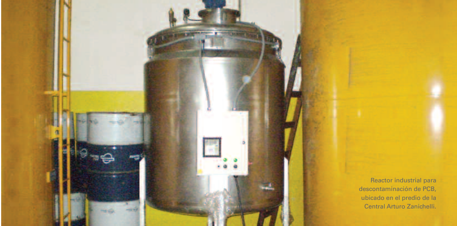
Reactor industrial para descontaminación de PCB, ubicado en el predio de la Central Arturo Zanichelli.

reactor fue diseñado con la colaboración de un especialista externo e instalado por personal de la División Transformadores en Pilar, donde se realizaron obras especiales para abastecer el consumo de energía del equipo. Actualmente, el reactor está listo para comenzar la descontaminación del aceite que tiene almacenado EPEC y en un segundo paso, ofrecer este servicio al resto de las empresas de distribución eléctrica o industrias que aún tienen transformadores con PCB y deben ser descontaminados antes del año 2010. Esto resultaría muy rentable para la Empresa, debido a que los valores de mercado para el tratamiento por kilogramo de aceite contaminado con PCB, actualmente superan los cinco dólares en la Argentina.