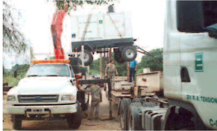
Las cuadrillas enviadas por EPEC a Santa Fe trabajaron contrarreloj con la asistencia de empleados de la EPE.

El destino fue Santa Fe, la ciudad más afectada por el agua. El operativo comenzó el día 29 de marzo, cuando un grupo de 15 operarios especializados de la Empresa, iniciaron el traslado de siete equipos de bombeo con sus correspondientes remolques, junto a los grupos de generación.