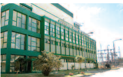
Repotenciación de Pilar: se lanza la licitación de la obra. Pág. 3