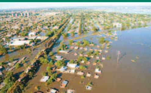
Inundación en Santa Fe: EPEC envió siete equipos de bombeo. Pág. 2

Revista de la Empresa Provincial de Energía de Córdoba