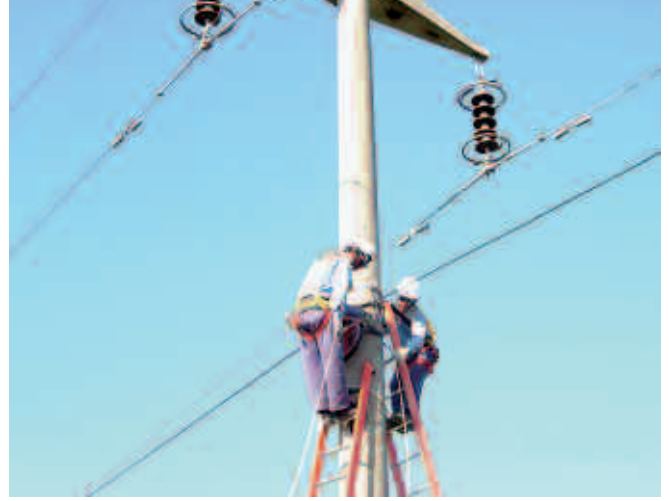
Personal de Construcción de Redes y Redes Alta Tensión, realizan el tendido de la fibra óptica en las líneas de 66 y 132 kV.

La instalación del cable sobre los apoyos de las líneas de alta tensión la realizó Construcción de Redes. En tanto, Redes de Alta Tensión intervino para la administración de las licencias y reglamentación del trabajo de AT bajo tensión. Sólo se contrataron servicios de terceros para la manipulación y transporte de los materiales. El personal, fue capacitado por los especialistas en telecomunicaciones de EPEC, quienes desarrollaron un procedimiento propio de instalación en la red de alta tensión. Por otra parte, se realizaron entrenamientos para el manejo del equipamiento de operación de la red de fibra óptica en Siemens, empresa fabricante de los equipos.